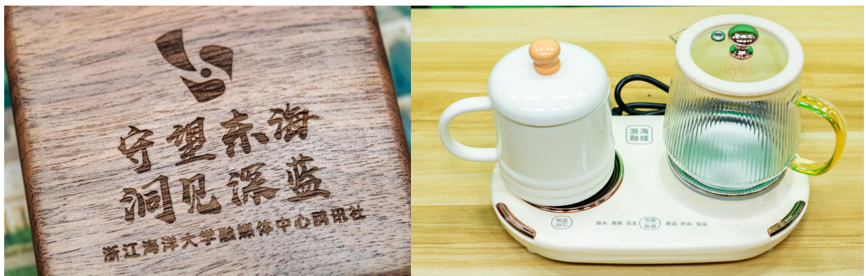
定制姓名木质礼盒套