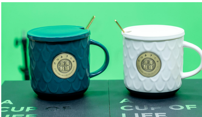
浙海融媒陶瓷马克杯礼品套（白、深绿）