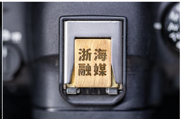
浙海融媒相机热靴盖