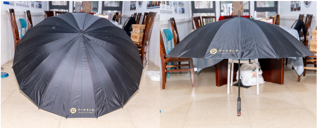
定制海大 16 骨防风加大伞