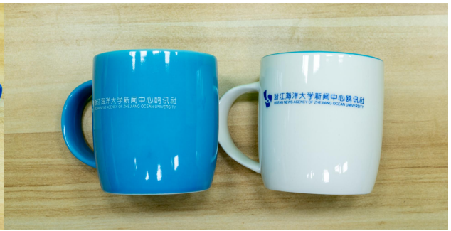
鸥讯社陶瓷马克杯（蓝、白）