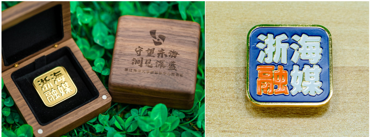
浙海融媒胸章（镀金磁吸款 金色、蓝色）