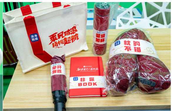
浙海融媒定制礼品袋